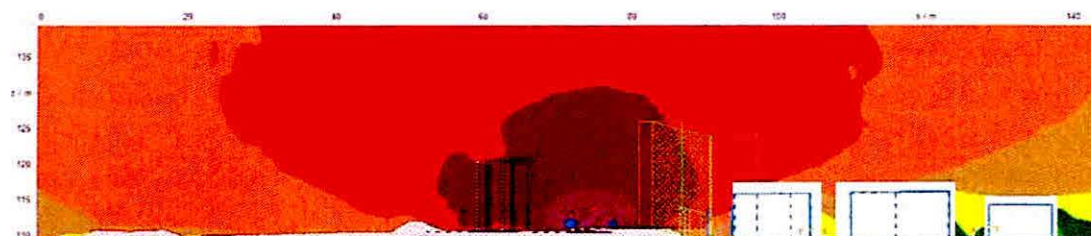
4.69: Híd keresztmetszete éjjel zajárnyékolással (a 71. és 70. sz. vv-ak együttes figyelembevételével)

A zajterhelés elsősorban a 70-es vasútvonalon történő csillapítása mellett szóló érv továbbá, hogy amennyiben a töltésen való áthaladáshoz képest 5 dB-lel hangosabb áthaladásokkal számolunk a 71-es vasútvonal hidján, a 70-es és 71-es vv-ak együttes zaj különbsége a talajon található források és a műtárgy várható zaja között nappal 7 dB, éjjel pedig 10 dB a talajon található források javára. Ez azt jelenti, hogy a híd zajának hozzájárulása nappal 0.8 dB, éjjel pedig 0.4 dB a talajon található zajforrások emissziójához, tehát mindkét napszakban 1 dB alatti lesz várhatóan – megfelelő zaj- és rezgéscsillapítás betervezésével (1 dB különbség az emberi fül számára nehezen megkülönböztethető „alsó határ” zajvédelmi szempontból). A terepszinten tervezett zajárnyékoló fal legalább 1 dB-lel csillapítja a jelen állapoti érték (távlati határérték) alá az eredő zajterhelést a műtárgy környezetében (vertikális gridszámítással bemutatott kritikus homlokzatok esetében).